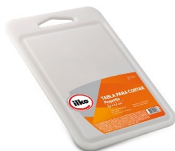
Tabla para Cortar Clásica