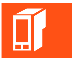
INSUMOS DE COMPUTACIÓN