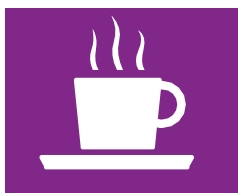
CAFETERÍA Y ABARROTES