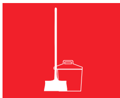
ASEO E HIGIENE