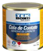
ADHESIVO DE CONTACTO UNIVERSAL TARRO 200 gr

SKU Surti Código Proveedor 43631 69957367189 (140gr) 43630 69957367190 (420gr)