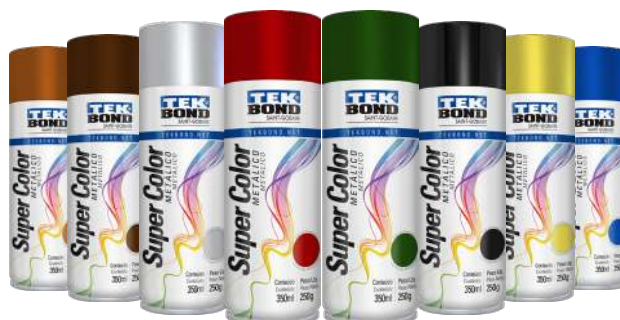
PINTURA SPRAY METÁLICO 350 ml / 250 gr BRONCE / COBRE /