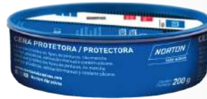
CERA PROTECTORA AUTOMOTRIZ CARCARE 200g