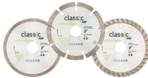
DISCO CLASSIC CONTINUO / SEGMENTADO / TURBO 180 x 22,23 mm