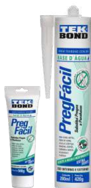
ADHESIVO SIN CLAVOS BLANCO 140 gr / 420 gr

SKU Surti Código Proveedor 43635 69957326781