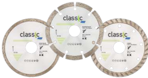
DISCO CLASSIC CONTINUO / SEGMENTADO / TURBO 110 x 22,23 mm