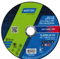
DISCO DE CORTE ACERO E INOXIDABLE CLASSIC 180 x 3,0 x 22,23 mm 115 x 1,0 x 22,23 mm 115 x 3,0 x 22,23 mm 180 x 1,6 x 22,23 mm