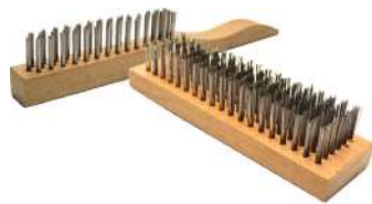
CEPILLO DE MANO SIN MANGO CEPILLO DE MANO CON MANGO 4 FILAS