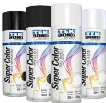
PINTURA SPRAY USO GENERAL 350 ml / 250 gr NEGRO BRILLANTE / NEGRO MATE BLANCO BRILLANTE / BLANCO MATE