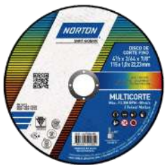
DISCO MULTICORTE MULTIMATERIAL 115 x 1,0 x 22,23 mm