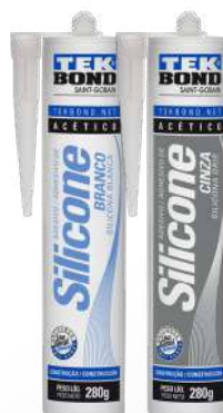
SILICONA ACÉTICA 280 gr BLANCO / GRIS / TRANSPARENTE

SKU Surti Código Proveedor 43634 69957326986 (130gr) 43626 69957326987 (305gr)