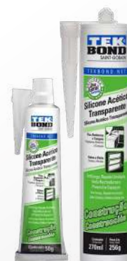
SILICONA ACÉTICA CONSTRUCCIÓN TRANSPARENTE 256 gr / 50 gr

SKU Surti Código Proveedor 43622 69957321900 (Blanco) 43622GR 69957321902 (Gris)