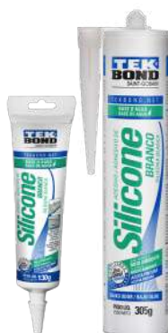
SILICONA BASE DE AGUA BLANCA PINTABLE 130 gr / 305 gr

SKU Surti Código Proveedor 43624 78072708182