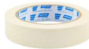
CINTA DE ENMASCARAR USO GENERAL 18 mm x 40 m / 24 mm x 40 m 36 mm x 40 m / 48 mm x 40 m