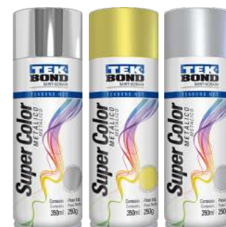
PINTURA SPRAY USO GENERAL ALUMINIO / DORADO / PLATEADO 350 ml / 250 gr