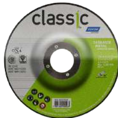
DISCO DE DESBASTE METAL CLASSIC 115 x 6,4 x 22,23 mm / 180x6,4x22,2mm