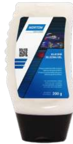
SILICONA GEL CARCARE 200g