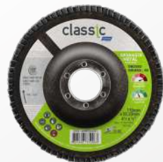
DISCO TRASLAPADO CLASSIC 115 x 22,23 mm G120 / G40 / G60 / G80