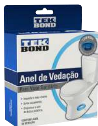
SELLO SANITARIO CON GUÍA - Ø 120 MM X Ø 87 MM

SKU Surti Código Proveedor 43623 69957321917