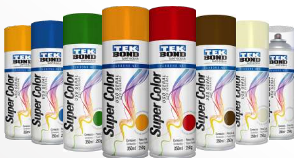
PINTURA SPRAY USO GENERAL 350 ml / 250 gr AMARILLO / AZUL / VERDE / NARANJA / ROJO / CELESTE AZUL OSCURO / CAFÉ / BEIGE / BARNIZ / BLANCO INVIERNO GRAFITO / PRIMER / ROSADO / VERDE OSCURO