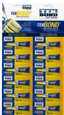
TEKBOND INSTANTANEO CARTÓN 12 x 2 gr

SKU Surti Código Proveedor 43635 69957326781