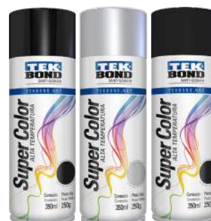
PINTURA SPRAY ALTA TEMPERATURA ALUMINIO / NEGRO BRILLANTE Y MATE 350 ml / 250 gr